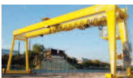
Pont roulant contrôle tous les ans