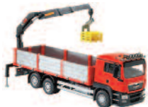
Grue auxiliaire contrôle tous les 6 mois