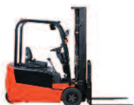
Chariot élévateur contrôle tous les 6 mois