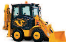
Engins de terrassement et de travaux publics

(tractopelle, chargeuse, pelle hydraulique, tombereau, bouteur, autobétonnière, etc.) contrôle tous les 6 à 12 mois