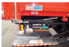
Hayon élévateur contrôle tous les 6 mois