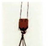
Accessoires de levage (palan, élingue, harnais, cé de levage, etc.) contrôle tous les ans