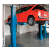
Pont élévateur ou table élévatrice contrôle tous les ans