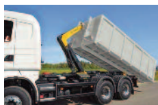
Bras de levage contrôle tous les 6 mois